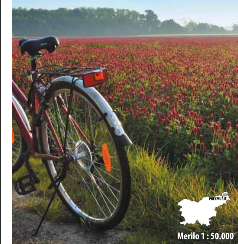
Merilo 1 : 50.000

Rekreativne poti Murska Sobota - Moravske Toplice z okolico