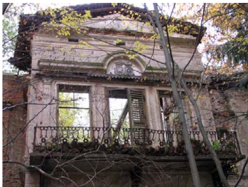
Podoba graščine danes